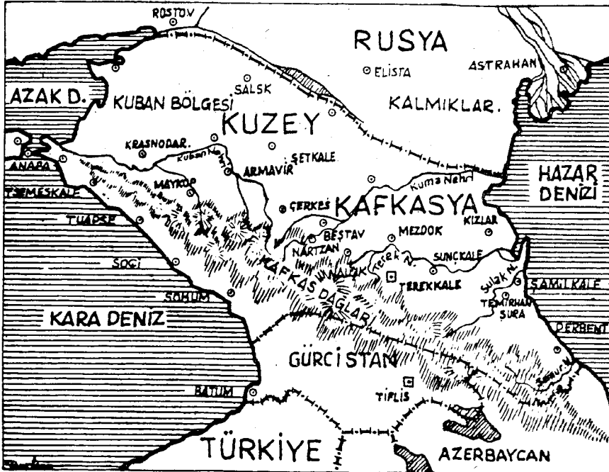
Kuzey Kafkasya'nın milli sınırları

SINIRLARI, Nüfus Ve YÜZ ÖLÇÜMÜ: Doğuda Hazar Denizi, batısında Karadeniz ve Azak Denizi, güneyinde Kafkas sıra dağları ile Azarbaycan ve Gürcistan cumhuriyetleri kuzeyinde de Kuma nehriyle küçük göllerin meydana getirdiği ve henüz kesin şeklini almamış olan ve Maniç adı verilen sınırla çevrili arazidir. 41,6-47,2 enlem ile 36,6-48,6 boylam daireleri arasında yer alan Kuzey Kafkasyanın yüz ölçümü yaklaşık olarak 268.000 Km 2 nüfusu da 4 milyondan fazladır. (Kuzey Kafkasyanın bağımsızlığını kazandığı 1918 yılında nüfusu 6.475.000, arazisinin yüz ölçümü de 268835 Km 2 idi.) DAĞLAR: Karadenizde Taman yarım adasıyla Hazar denizinde Apşeron yarım adası arasında uzanan, orta kısımları