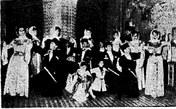
Ankara Kuzey Kafkasya Kültür Derneğinin Kafkas gecesine katılan folklor ekibi